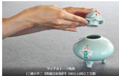
タッチ&トーク風景 (三浦小平二《青磁豆彩香炉》2005)